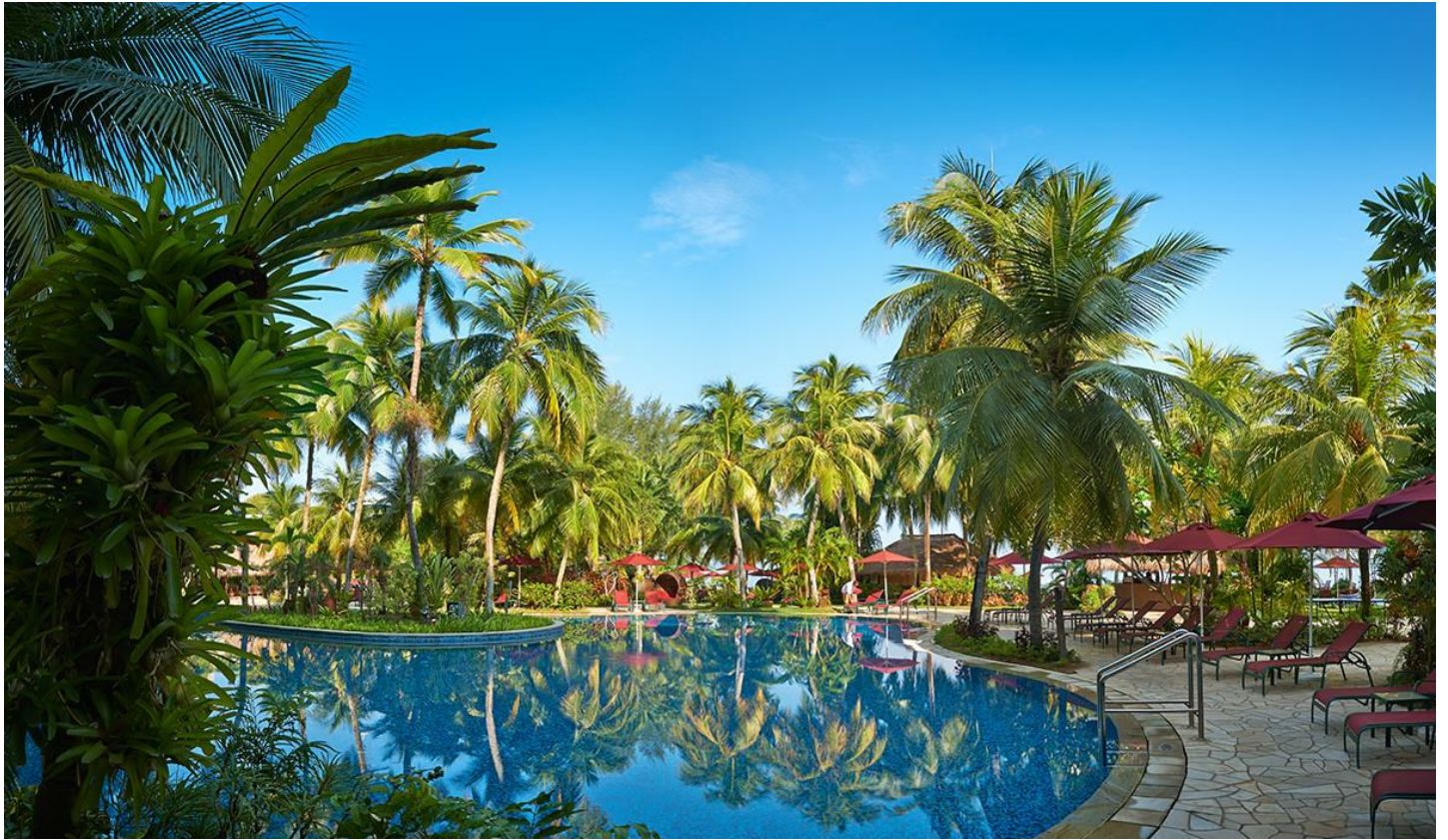
Batu Ferringhi Beach

Ungezwungenes Erstklasshotel in einem Palmengarten am Feringghi-Strand – ausserhalb der Stadt