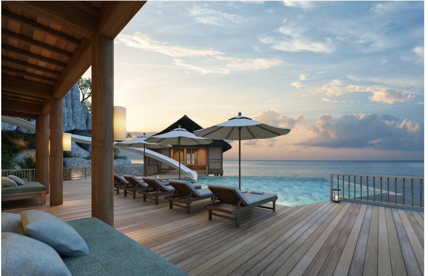
Ninh Van Bay

Das luxuriöse Six Senses Ninh Van Bay ist ein idealer Ort um auszuspannen. Es herrscht eine ruhige Atmosphäre an traumhafter Lage mit viel Privatsphäre.