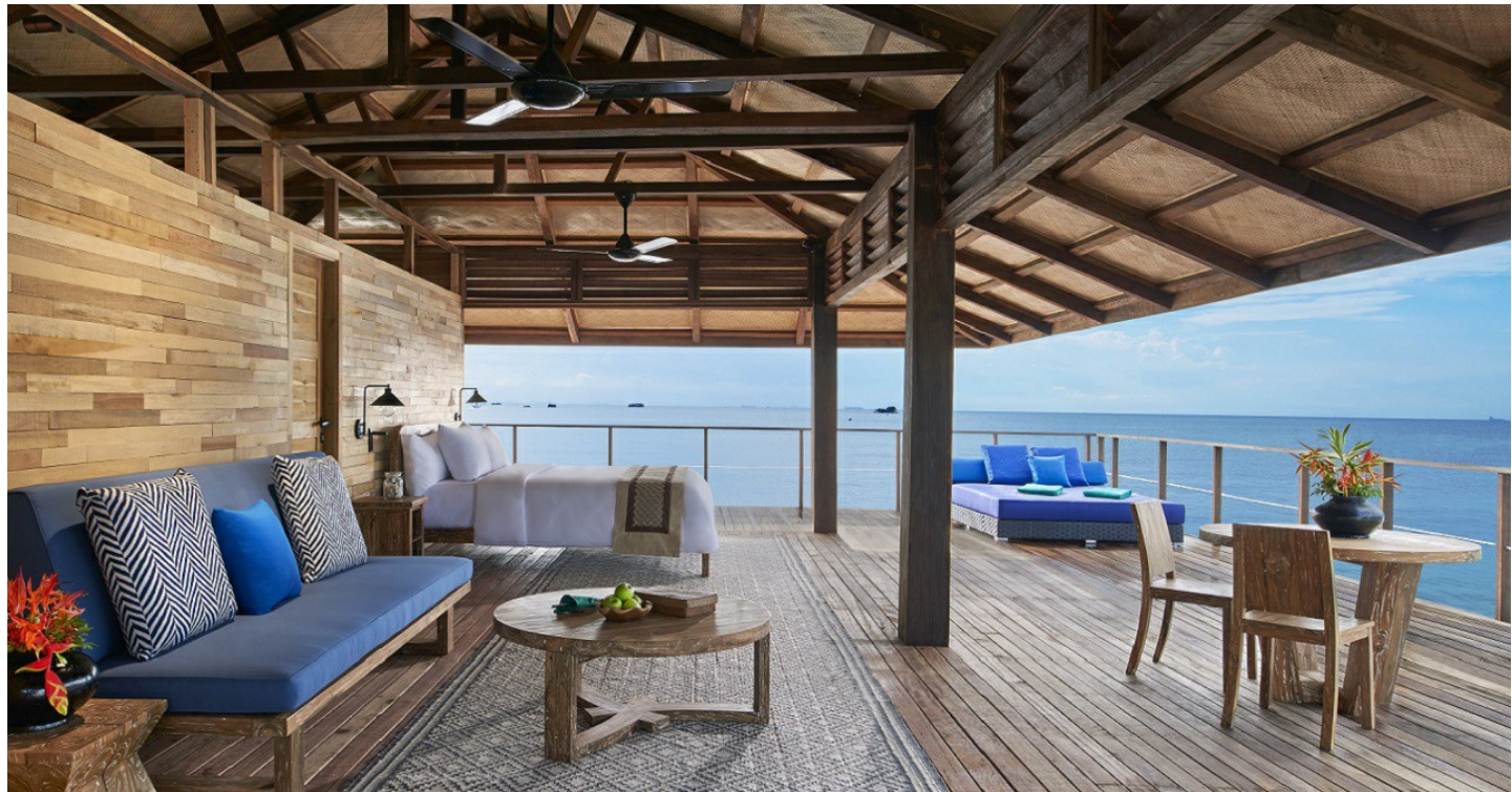
Tanjong Said Bay

Komfortable Villen im balinesischen Stil mit freier Sicht auf den Garten oder den Ozean – das erwartet Sie im Banyan Tree Bintan. Freuen Sie sich auch auf das erstklassige Spa!