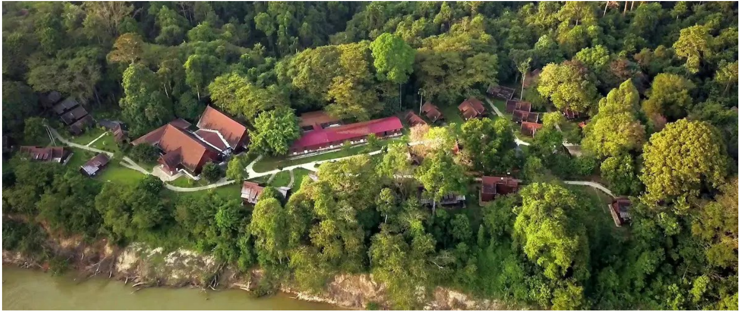
Taman Negara NP

Naturliebhaber werden im Mutiara Taman Negara begeistert sein vom einzigartigen Dschungelerlebnis, das sich hier bietet.